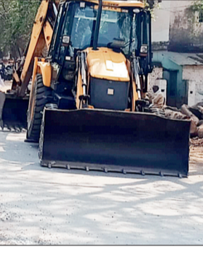
मरम्मत कराना शुरू किया, तो गुणवत्ता और प्रक्रिया पर सवाल उठने लगे हैं। कांग्रेस ने आरोप लगाया कि यह पहला अवसर है जब ठीक सड़क को जानबूझकर उखाड़कर नया

डोंगरगढ़- ढारा सड़क विवादों में आ गई है। लोक निर्माण विभाग द्वारा मरम्मत कार्य शुरू करते ही कांग्रेस और भाजपा के बीच आरोप-प्रत्यारोप का दौर तेज हो गया है। कांग्रेस ने इसे अच्छी सड़क को खराब कर भ्रष्टाचार करने का आरोप लगाया है। वहीं भाजपा ने आरोप को खारिज करते हुए इसे विकास बताया है। जानकारी के अनुसार उक्त सड़क की स्थिति लंबे समय से खराब है। जगह-जगह गड्ढों के कारण आमजन को आवागमन में परेशानी हो रही थी। कांग्रेस ने इस मुद्दे को लगातार उठाया था और अब जब पीडब्ल्यूडी ने