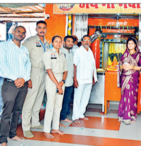
हरिभूमि न्यूज ►► डोंगरगढ़