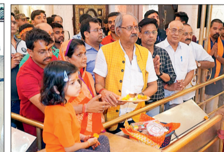
हरिभूमि न्यूज ►► डोंगरगढ़