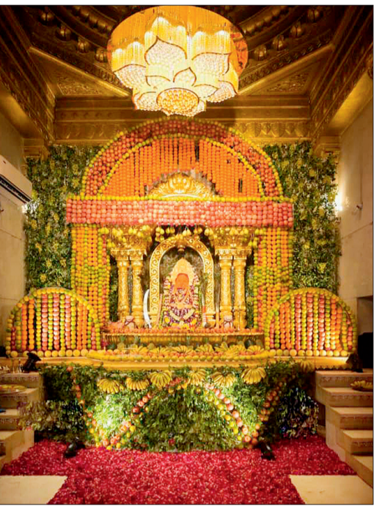
हरिभूमि न्यूज ►► डोंगरगढ़

पंचमी को माता बल्लेश्वरी का काल भैरव के आहवान के साथ अभिषेक श्रृंगार किया गया। पुरानी परंपरा के अनुरूप माता के पंचमी अभिषेक को अष्टधाती भगवती बगला मुखी स्वरूप के रूप में दर्शन को विशेषमहत्व दिया गया है। उपर और नीचे मंदिर में आचार्यों ने मंत्रोच्चार के साथ पट बंद कर माता की आराधना की। इस मौके पर गर्भग्रह को फलों से सजाया गया था जिसमें मौसमी फल 105 किलो, अनार 80 किलो, अंगूर 30 किलो, तरबुज 40 किलो, खरबुजा 10 किलो, आम 20 किलो, केला 50 किलो, नासपाती 40 किलो, पाईनएप्पल 40 नग का उपयोग किया गया। छठ व सप्तमी को सजाए गए फलों को प्रसाद के रूप बांटा जाएगा। सप्तमी को काल रात्रि अभिषेक होगा।