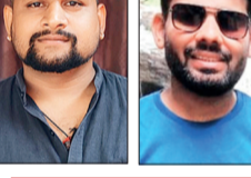
सभी वर्ग के युवाओं को कार्यकारिणी में मिला मौका